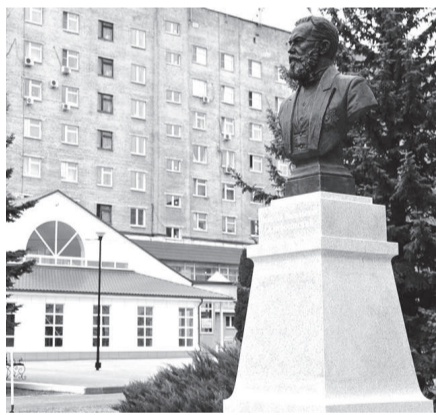
Памятник русскому врачу Николаю Склифосовскому