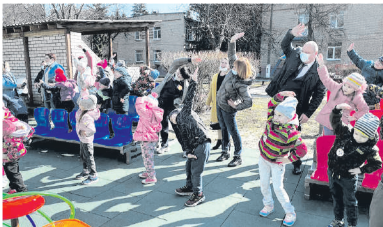
Детский сад №77

радостный возглас одного из малышей утонул в звуках олимпийского гимна.