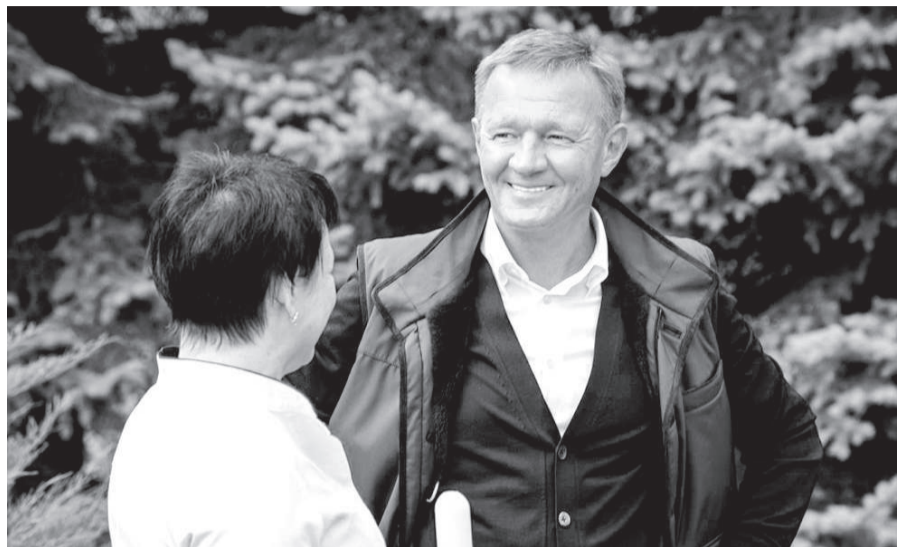
Роман Старовойт принял участие в закладке памятной аллеи

В озле областной клинической больницы продолжается строительство инфекционного госпиталя. Там уже возвели фундаментальную плиту и подняли стены подполья. Сейчас возводят перекрытия на первом этаже и занимаются подведением инженерных сетей.