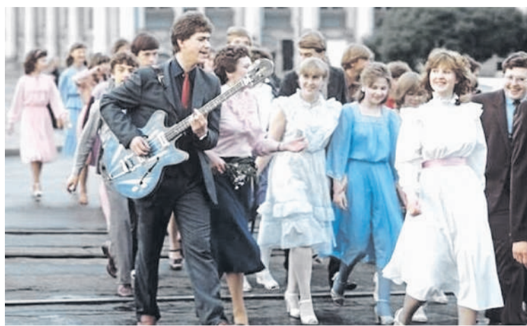
Первая любовь, школьные года.

Пока на Западе Бриджит Бардо протестует против убийства животных, в СССР входят в моду каракуль и норка. Предел мечтаний простых людей – цигейковая шубка. Еще бы: в 1970-е норковая шуба стоила как автомобиль «Жигули» (5500 руб.), а кара-