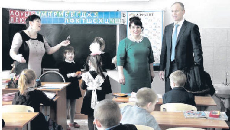
В гости приехал депутат Госдумы Александр Брыксин

В тот день мы засиделись чуть ли не «до первой звезды»: вкусное угощение, приятные собеседники.