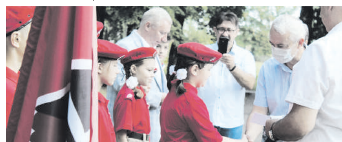
Щигровские школьники вступили в Юнармию