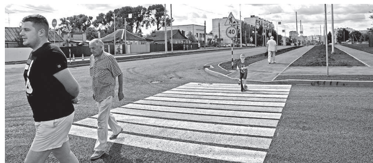
Улица Бойцов 9-й Дивизии