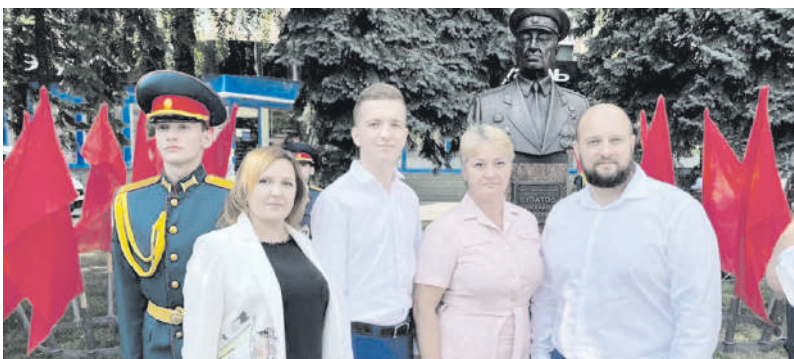
В Курске открыли памятный знак Михаилу Булатову