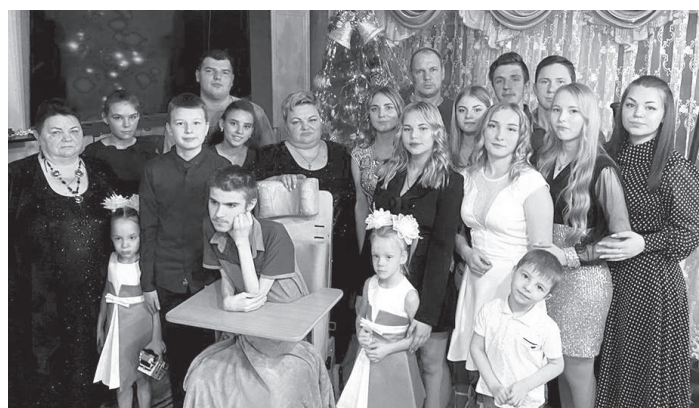
Семья Брахновых из Суджанского района

В штабе общественной поддержки партии «Единая Россия» 20 августа прошла интеллектуальная игра «РИСК: разум, интуиция, скорость, команда».