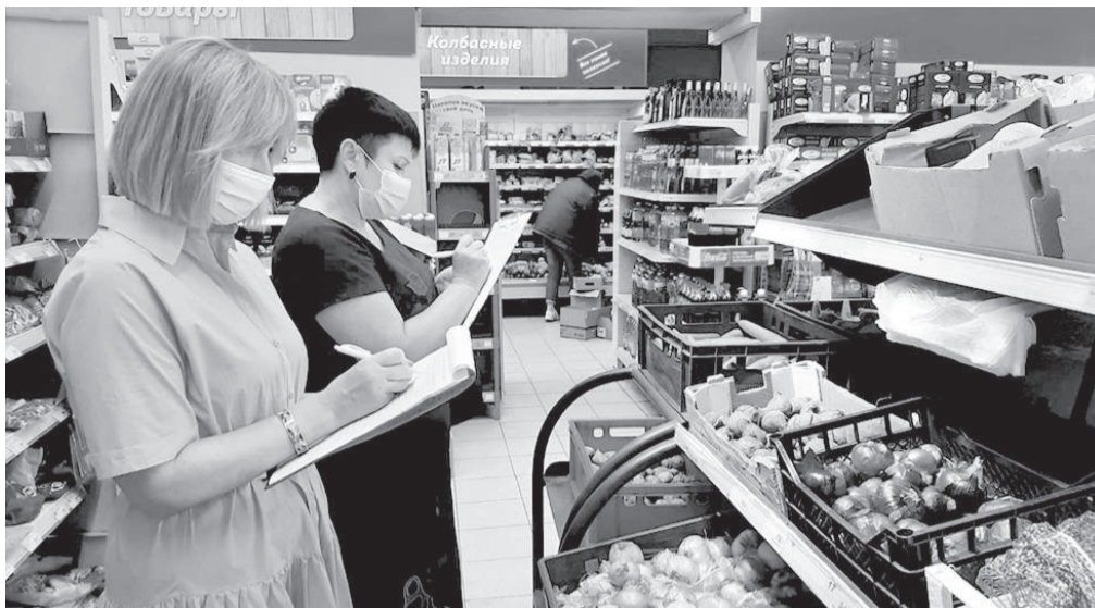
Рейд «Народного контроля» в Железнодорожном округе

набора», после сравнительного анализа цен отметили, что приготовить борщ стало дешевле.