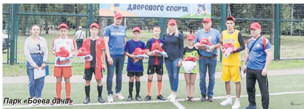
Парк «Боева дача»

Единороссы приняли участие в праздничных мероприятиях в честь Дня физкультурника.