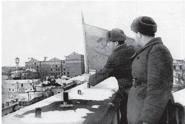
Освобождение Курска 8 февраля 1943 года

столько же умерло от эпидемий и голода, не считая военнопленных в лагерях рядом с городом.