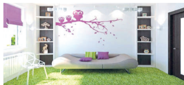
Избавляемся от визуального шума в доме

Начните с повседневных мелочей. Тазик, детский горшок, лоток для кота и любые другие пластиковые предметы подберите нейтральных цветов. Например, белого, серого, бежевого или коричневого.