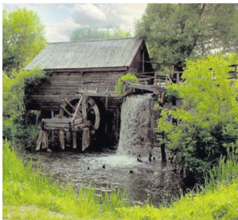
Село Красниково станет центром туристического притяжения

Предполагается, что этнодеревня будет включать порядка 25 строений. Та-