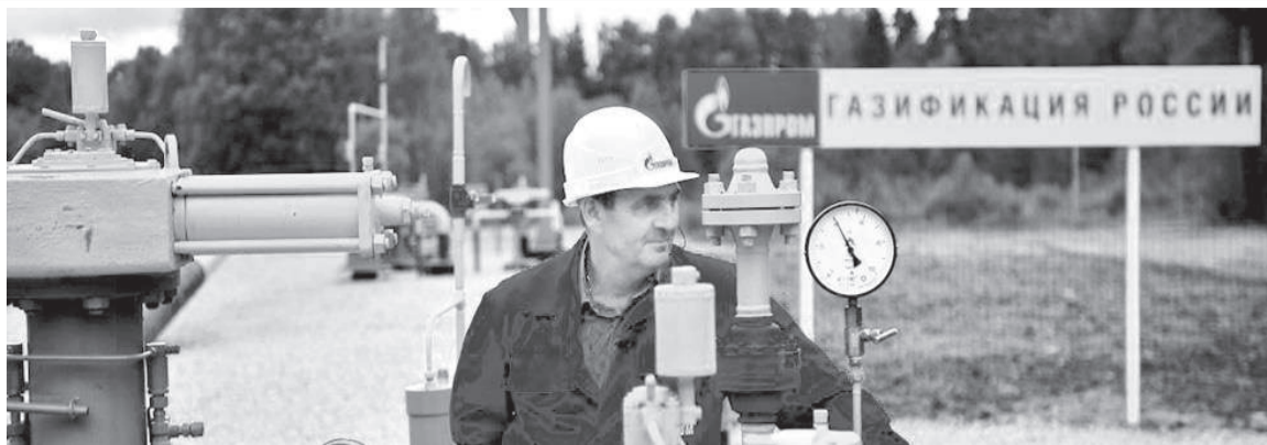
В Курской области полностью газифицирована почти половина районов

– В Курской области уже полностью газифицирована