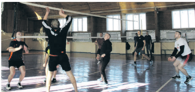
Волейбольный турнир в Черемисиново

Секретарь местного отделения «Единой России», глава