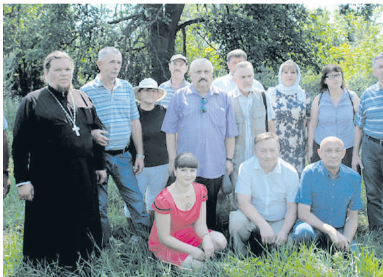
Карповские чтения в Хомутовском районе

Пимена Карпова, автора романов «Кожаное небо», «Верхом на солнце» и других самобытных произведений, хорошо