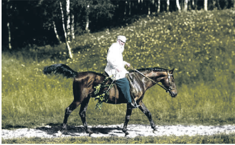
Лев Толстой на конной прогулке

рил: «Чувствую себя сравнительно с людьми (средним человеком) моего возраста более сильным и здоровым».