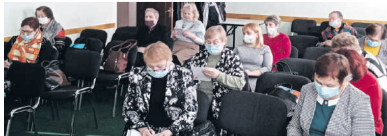
Семинар в рамках партпроекта