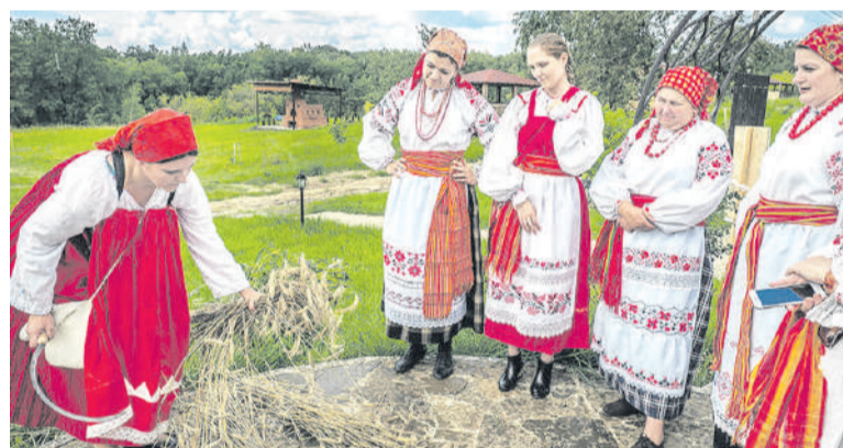
Фестиваль «Дни жатвы»