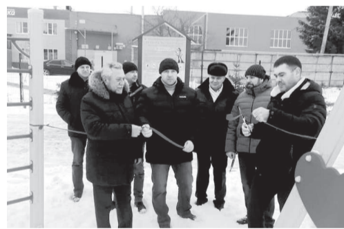
Открытие детской площадки в Судже