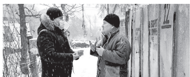
Препарат доставили по адресу