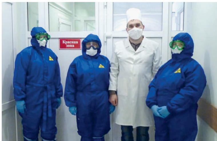
Лучшая оценка работы — мнение пациентов

Нижайший поклон врачам, которые ни на минуту не оставляют своих пациентов, следят за их состоянием, учат правильно лежать и дышать.