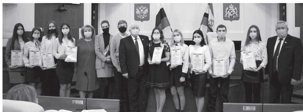
Единороссы награждают студентов