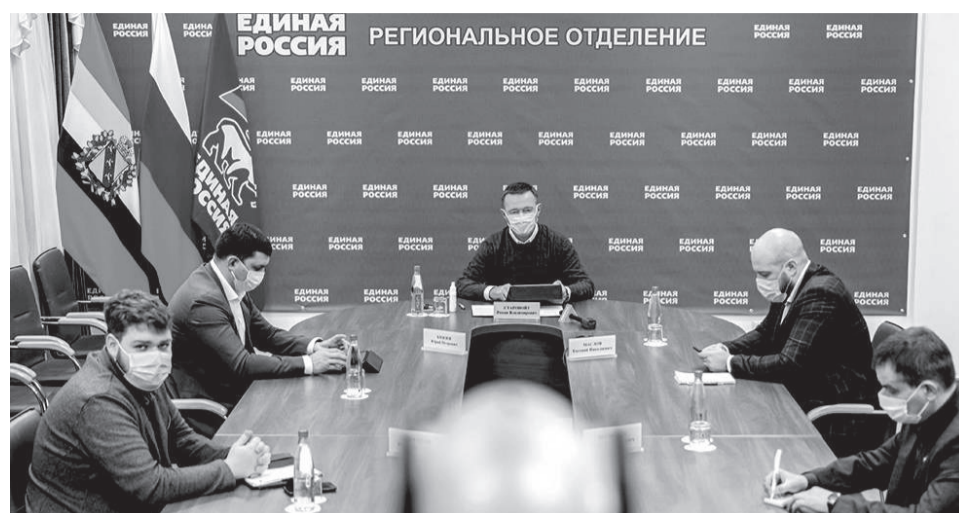
Роман Старовойт принял участие в онлайн-форуме «Единой России»

Основными направлениями добровольческой деятельности по-прежнему остаются автоволонтерство и доставка горячего питания медикам. В первый месяц нового года автоволонтеры по всей стране сделали уже почти 50 тысяч выездов, рассказал Андрей Турчак.