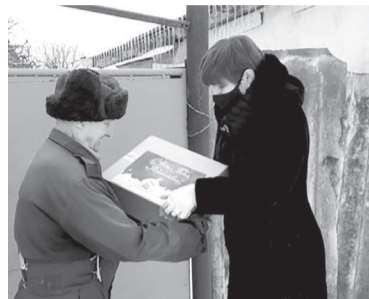
Подарок к праздникам

– Мне непринципиально было, в каком селе или деревне поселиться, главное – за городом, поближе к природе, – говорит она. – Свежий воздух, овощи с грядки, своя картошка – мне это всегда