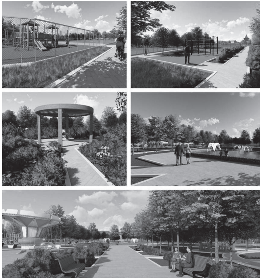
Вариант проекта благоустройства парка на ул. Союзной