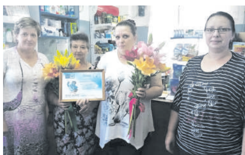
Почтальоны принимают поздравления