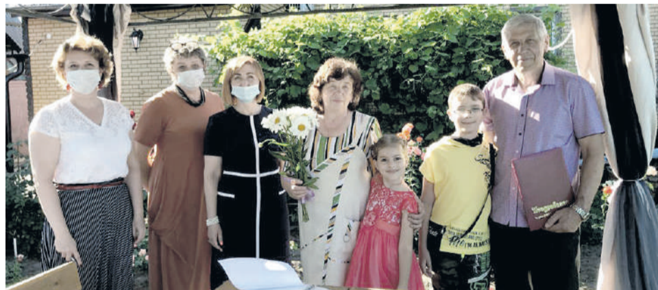
Цветы от единороссов семье Гончаровых