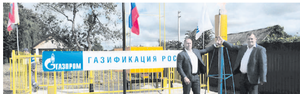
Открытие газопровода в Железногорском районе

— На какой стадии находится проект в нашем регионе?