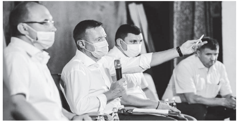
Роман Старовойт в Льговском районе