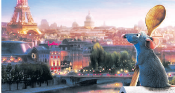
Кадр из мультфильма «Рататуй»

го мультфильма в мире про крысёнка-повара рататуй готовил знаменитый шеф-повар Томас Келлер.