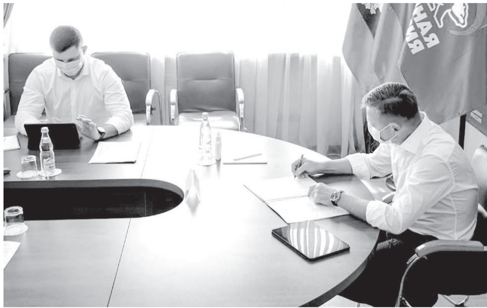
Участники онлайн-совещания в Курском региональном исполкоме партии