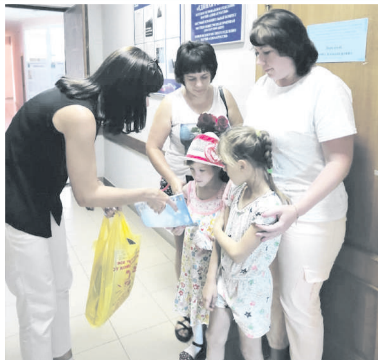
Семьи с детьми в центре внимания

прошли 85 онлайн-приемов. Мы провели шесть недель тематических приемов, которые затрагивают самые актуальные сферы жизни земляков. Среди них – здравоохранение, проблемы ЖКХ, дачных и садоводческих товариществ, социально-правовые вопросы старшего поколения, материнства и детства. А 25 июня у нас прошел Всероссийский единый день оказания бесплат-