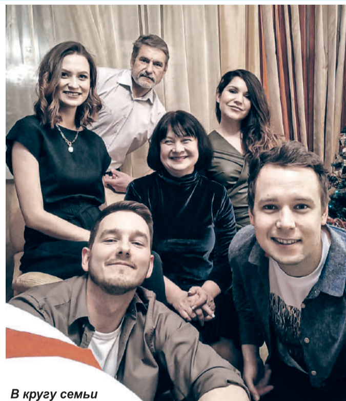
В кругу семьи

Модное блоггерство или тысячекратнее искусство плетения из