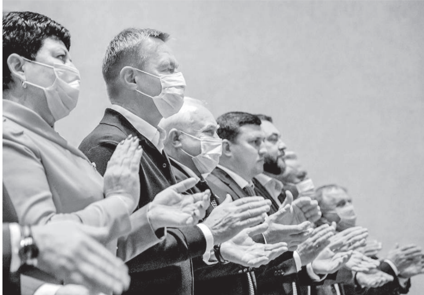
Курские единороссы выбрали делегатов на Съезд партии

В Областном дворце молодежи 9 июня состоялся первый этап XXXIV конференции регионального отделения «Единой России».