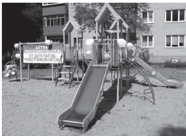
ПРИХОДИТЕ – ПОМОЖЕМ