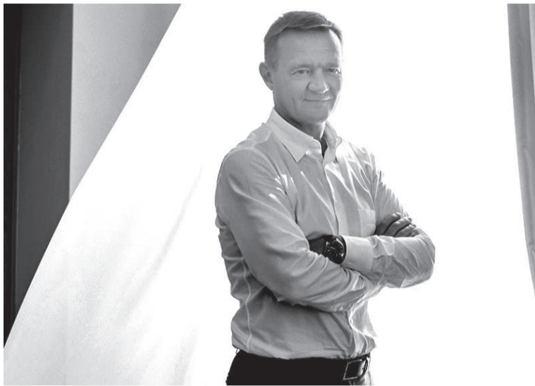
Роман Старовойт возглавил региональный оргкомитет по проведению ПГ

В ПРОЦЕДУРЕ ПГ МОГУТ УЧАСТВОВАТЬ БЕСПАРТИЙНЫЕ РОССИЯНЕ