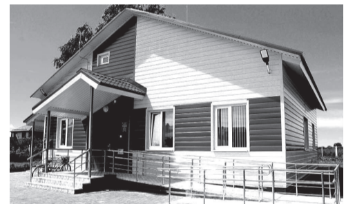
Новый ФАП в Беловском районе

В районе выполнили все указы по водоснабжению, газификации, образованию и культуре. Отремонтировали спортивные залы в Долгобудской, Беловской, Вишневской, Коммунарской школах. Открыли восьмую модельную библиотеку, отремонтировали улицы Мира и Новоселовку в селе Белица, улицу 2-я Пятилетка в