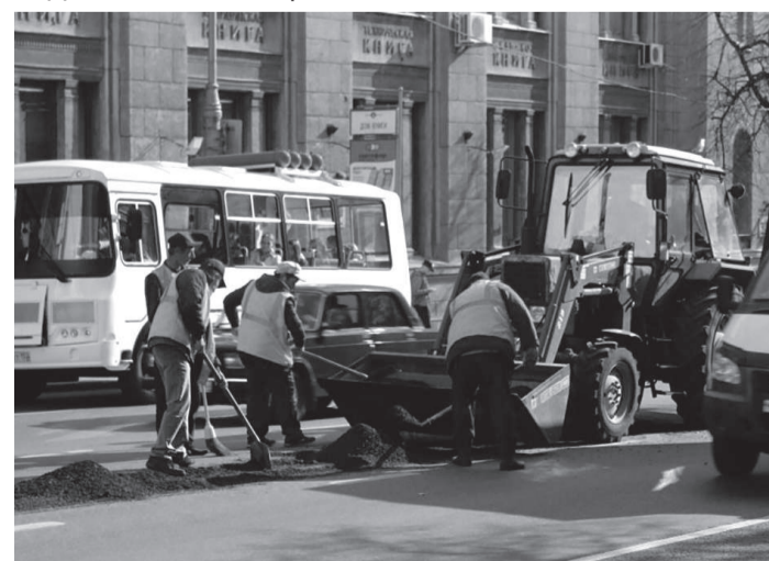
Глубокая яма — это аварийно опасное место