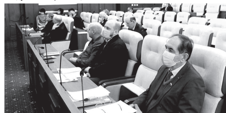
Совет руководителей фракций «Единой России»