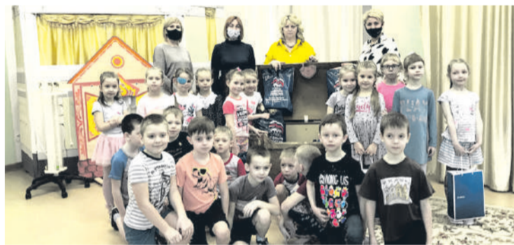
Социальная акция в садике №24