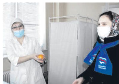
Апельсины — врачам

В завершении акции врачам и пациентам волонтеры раздали витаминное угощение – спелые апельсины.