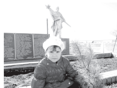
Сажаем саженцы сосны

Те годы научили сплоченности, взаимопомощи. Эти качества погожинцы сохраняют из поколения в поколение.