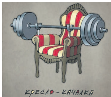
КРЕСЛО - КАЧАЛКА

Весна отличное время начать заниматься спортом и меняться к лучшему. Каких ошибок нужно избегать в спортзале новичкам, нам рассказали опытные спортсмены и тренеры.