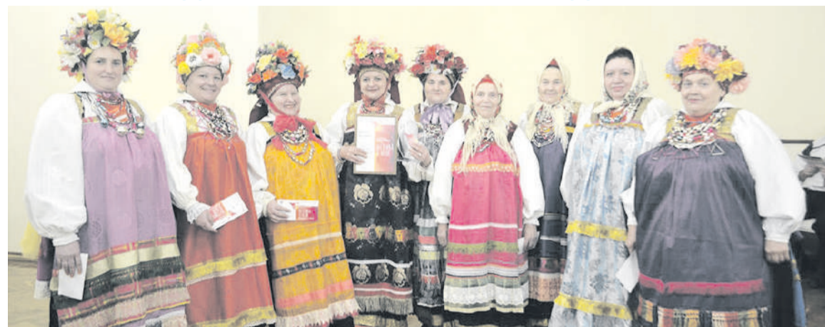
Народный ансамбль села Илек

бое время суток она спешит к своим пациентам.