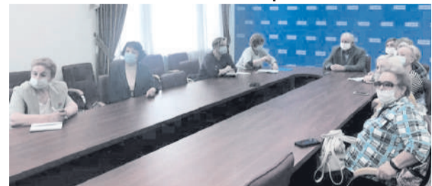
Участники онлайн-форума в региональном исполкоме «Единой России»

Обязанность по обеспечению надлежащего технического состояния и безопасной эксплуатации внутридомового газового оборудования, а также по заключению договоров возложена на потребителя или уполномоченное им лицо — управляющую компанию.