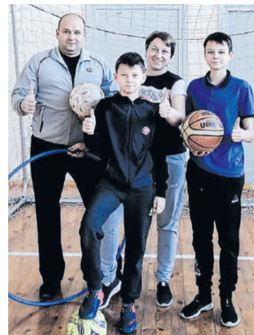
Семья дает мне силы

Мы 5 мая приняли участие во флеш-мобе, посвященном дню рождения со-