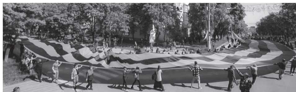
Самая большая в мире Георгиевская лента

Впервые за много лет на освобожденных от нацистов территориях Донецкой и Луганской народных республик, Харьковской, Херсонской областей без страха отметили День Победы.