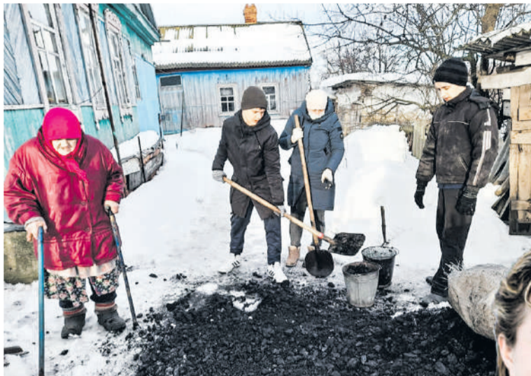
Волонтеры помогают пожилой сельянке

нужным. Кто будет приносить позитив и добро, если не я? Нет ничего лучше улыбки людей, которым ты помогаешь. Только так можно понять, что живешь эту жизнь не зря.