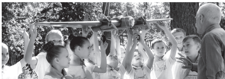
В оздоровительных лагерях смогут отдохнуть 15 тысяч детей