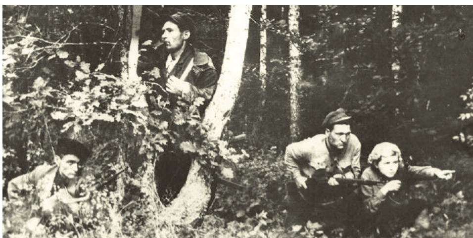
Дмитриевские партизаны в разведке