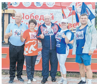
Забег «Курский характер»

Петь в церковном хоре – это особая миссия. Совсем другое ощущение. Духовная музыка сама по себе красива. Ее невероятно интересно исполнять.