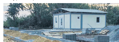
Новый ФАП в Советском районе

Его стоимость – 3,7 миллиона рублей. Капитальный ремонт больницы проходит по программе модернизации первичного звена здравоохранения в рамках нацпроекта. Завершены штукатурные работы, ведется замена элек-